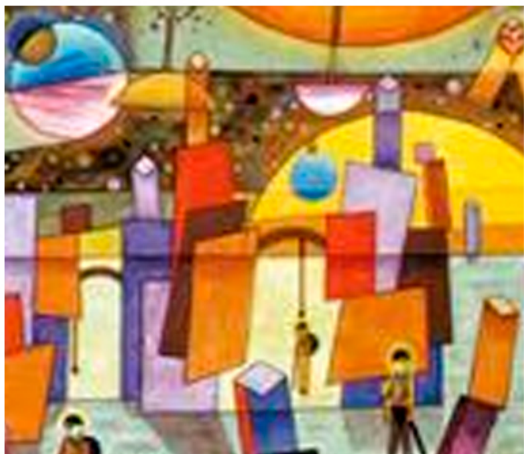
Xul Solar, pintor argentino

“A arte existe para que a realidade não nos destrua”, disse Friedrich Nietzsche. O que isso significa? No cotidiano, podemos esquecer da relação que estabelecemos com a arte, mas ela se faz presente de modo sutil em nossas vidas. Por exemplo, nas músicas que escutamos para amplificar o que sentimos; nas séries e filmes que vemos; nos passos que damos em danças solitárias ou em companhia das