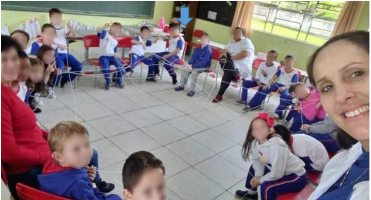
Figura 6 - Dinâmica da teia de aranha