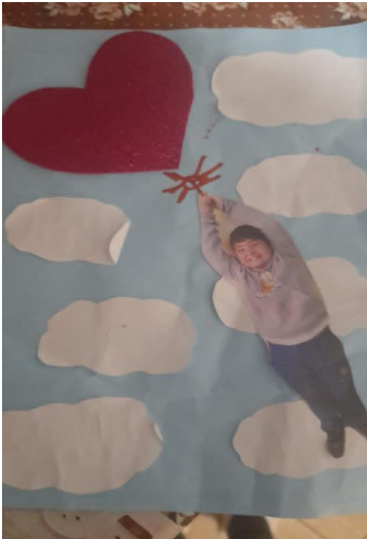
Figuras 1 e 2 - Frente e verso do cartão do dia das mães