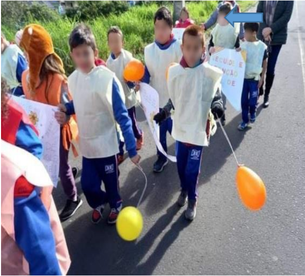
Figuras 11 e 12 - Trabalho de campo com a turma