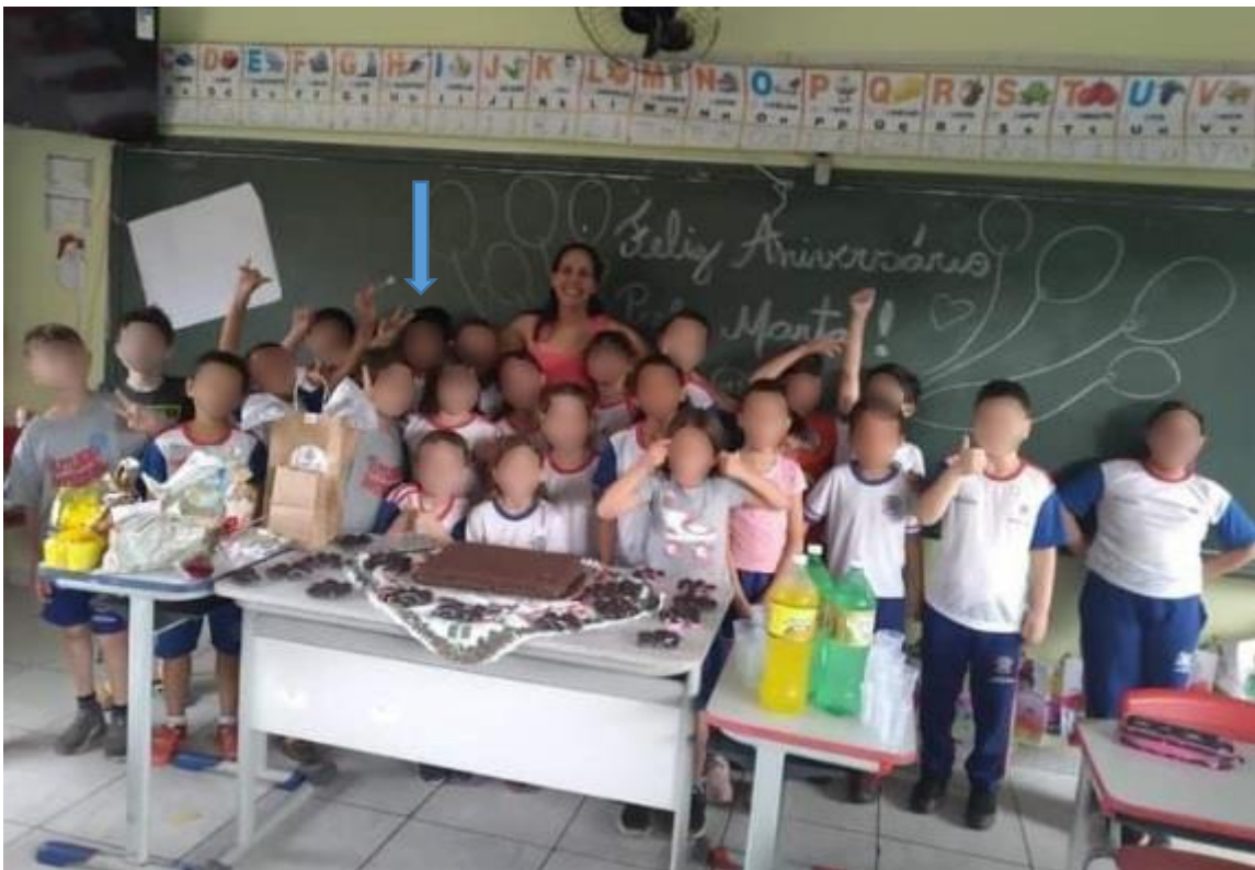
Figura 14 - Momento de descontração na turma no aniversário da autora

A seguir, a Figura 14 é o registro de uma memória afetiva com esta turma que organizou carinhosamente uma festa de comemoração do meu aniversário.